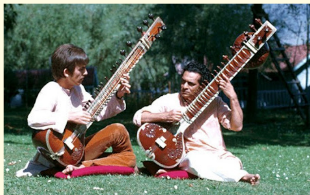
George tocando sitar com Ravi e em seu refúgio (abaixo).

George, Ravi e suas esposas, Pattie e Kamala, viajaram para a Índia, onde George teve o primeiro contato com a religião indiana e com os livros sobre Yoga, especialmente o Raja Yoga , escrito por Swami Vivekananda, que lhe ensi-